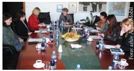
V podjetju Adria Mobil se je 12. novembra sestel upravni odbor sekcije managerk.